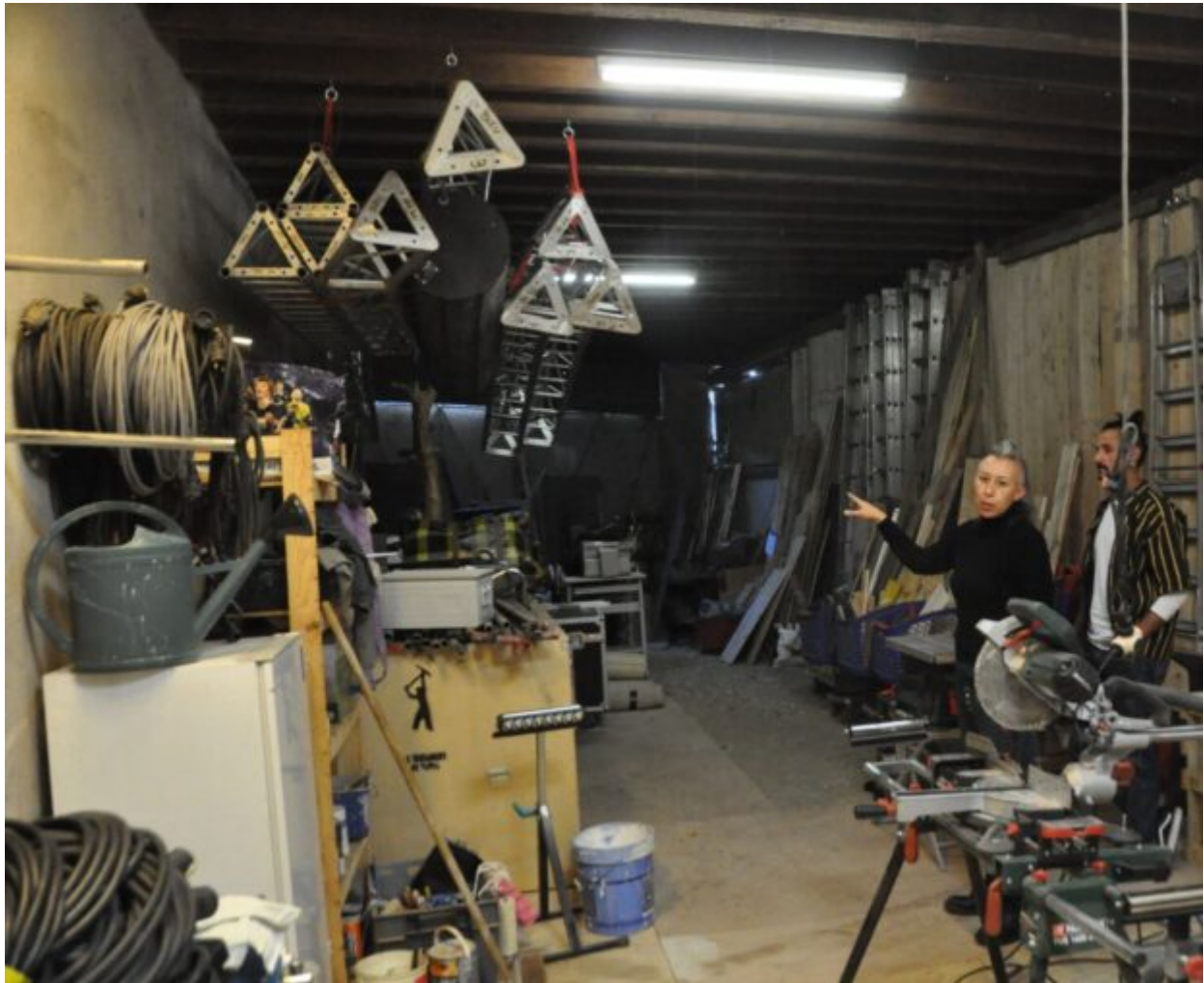
L'atelier construction de décors, un élément important pour l'avenir des lieux

Au bout de la rue Bernardin, au n°2, à l'angle de la rue Pierre-Gauthier, se trouve une maison de ville comme les autres. Une bâtisse qui ne sort pas du lot. Un bâtiment qui ne déborde pas, ne jure pas dans l'agglomération castelroussine. Comme les autres mais pas tout à fait pareil. Au-delà de ses portes, ce n'est pas comme ailleurs. Ici c'est ZRA, zone de recherche artistique. Derrière ces murs on fait dans le plâtre mais pas que sur les enduits. On fait aussi peinture, celle qui s'expose dans des cadres ou pas. Comme une pépinière ou une éclosière pour les petits jeunes qui se lancent dans cette intermittence qui ne donne pas toujours à bouffer. Bosser sur les planches de la grande salle de travail est désormais possible. On peut passer par la cuisine avant le boulot. Si le spectacle ne remplit pas toujours les ventres, les amis peuvent toujours passer ... Théâtre – danse – musique – arts vivants qu'il est écrit quand on fait une recherche internet. Tout un programme sans entracte, sans intermède pour apporter un regain de vie dans le quartier, pour apporter un coup de main aux artistes. Ici c'est le Chauffoir des 3 Cris et de La Bolita Cie.